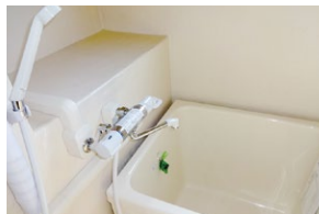
浴室(給湯シャワー付) ※浴槽はFRP製。ステンレス製の ものもあります。