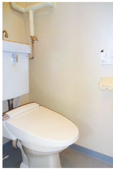
トイレ(ウォシュレット付)